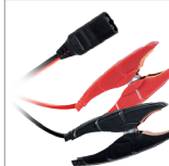
Pinces (35 cm)